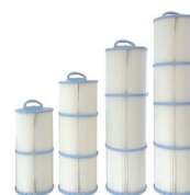
4 tailles de cartouches : C3-C5-C6-C7

Les cartouches Weltico permettent une filtration fine (15 microns)