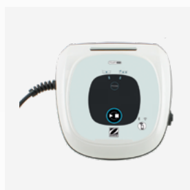
Boîtier de commande