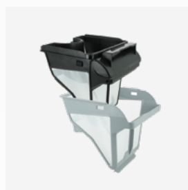
Bac filtrant Filtre double niveau : 150/60 µ