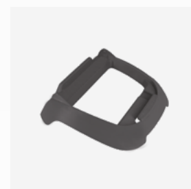
Socle pour boîtier de commande